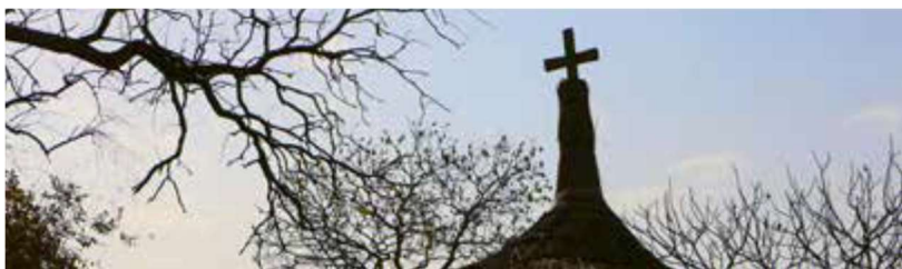
Križ na krovu crkve u izbjegličkom kampu na jugu Sudana