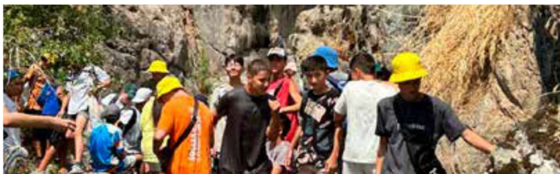
Ljetni kamp u središnjoj Aziji

Molimo se za to da djeca i mladi koji sudjeluju u kampovima pronađu bezbrižnost, radost, obnovu i dubinu Božje ljubavi.